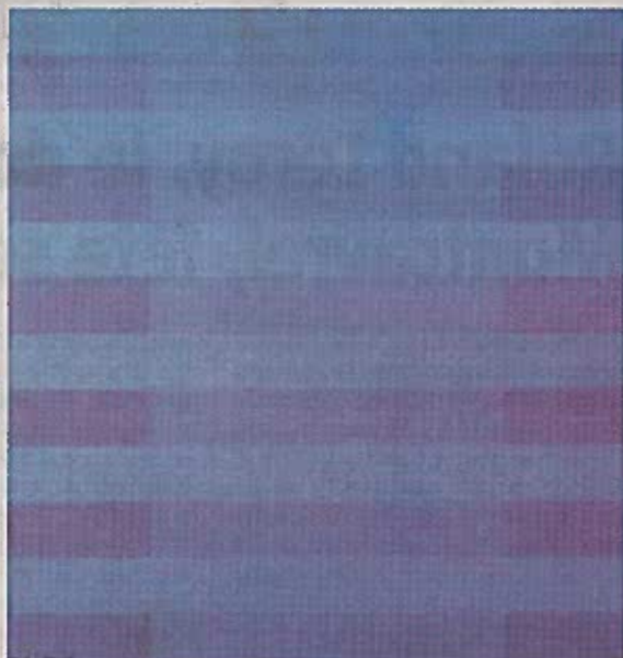
Acrylique sur toile de M.Th. Vacossin.