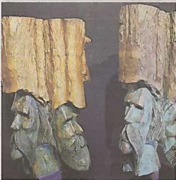
Sculptures en bois et en bronze de Daniel Barsby.