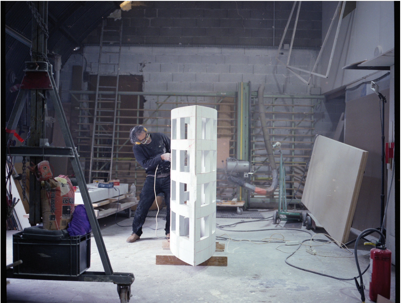
Vue d'atelier à Meudon - Juillet 2022