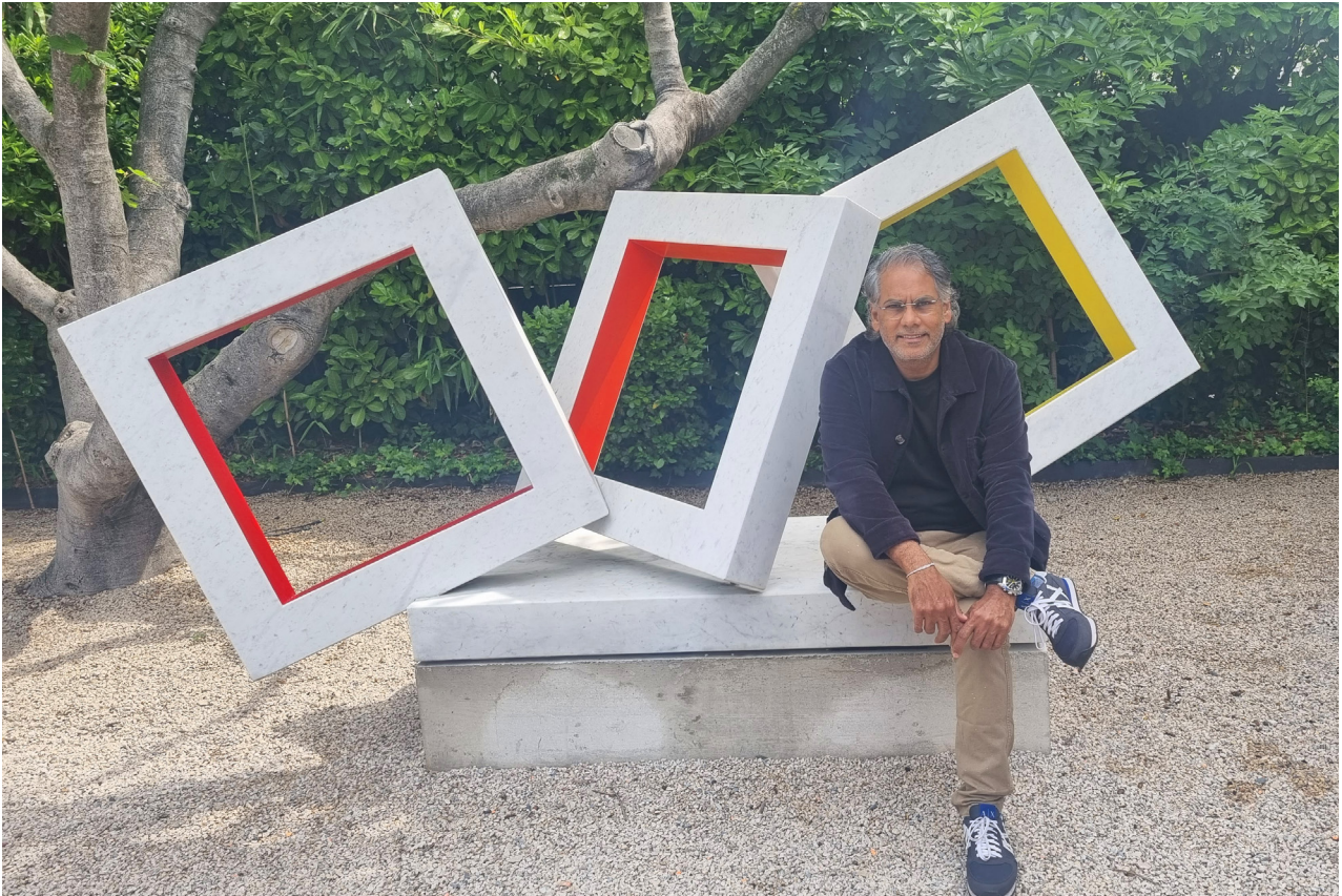
3 Stelas Bonnieux - 2013 - 144 x 300 x 105 cm - Marbre blanc de Carrare et acrylique - Collection privée