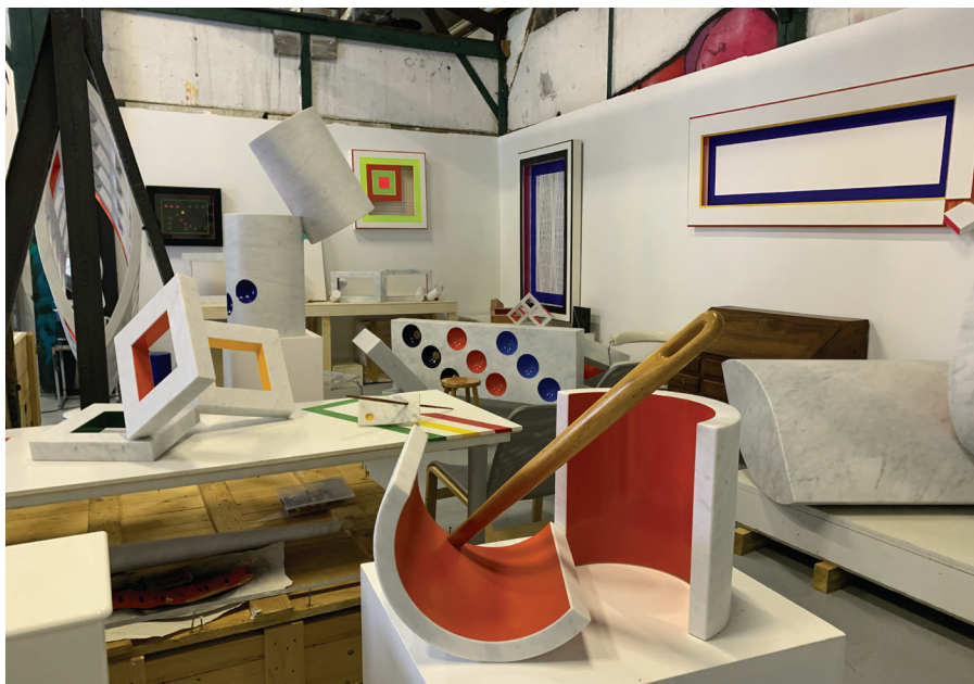
Vue d'atelier - Meudon - Juillet 2022

150 ème Anniversaire de l'Angélus de Millet – Espace Culturel Marc Jacquet (Barbizon)