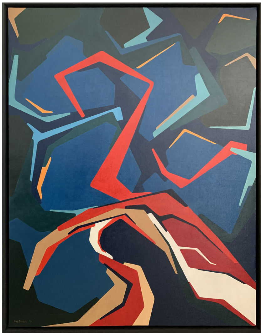
Sans titre - 1959 Huile sur toile - 96 x 77 cm - œuvre unique